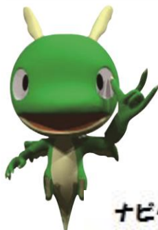
ナビゲーター eye龍 (あいろん)

奈良県における聴覚障害者用の録画物の製作及び貸出事業としては、身体障害者福祉法三十四条の範囲に基づいて「製作」と表記されますが、近年 視聴覚障害者情報提供施設としての役割は、広範囲にわたっています。その中で「制作」という呼称を使用することが多くなっていますので、まほろばだよりでは「制作」で統一させていただきます。ご了承ください。